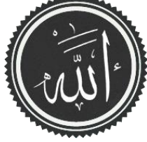
అరబీ భాషలో అల్లాహ్

అల్లాహ్ అనేది అరబీ భాషలో “ఏకైక ఆరాధ్యుడు, సకల లోకాల సృష్టికర్త మరియు ప్రభువు” యొక్క స్వంత పేరు. అల్లాహ్ కేవలం ముస్లింల కొరకు మాత్రమే ఆరాధ్యుడు కాదు, ఆయన సృష్టిలోని ప్రతిదానికీ ఆరాధ్యుడు ఎందుకంటే వాటన్నింటినీ సృష్టించింది మరియు పోషిస్తున్నదీ ఆయనే.