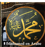
Mohamed en Arabe