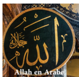
Allah en Arabe

Mosquée (Masjid) : renvoie à un lieu de culte, propre, utilisé par les musulmans essentiellement pour accomplir les prières et les actes d'adoration.