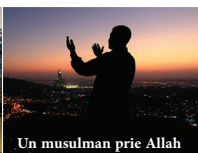
Un musulman prie Allah