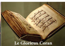
Le Glorieux Coran